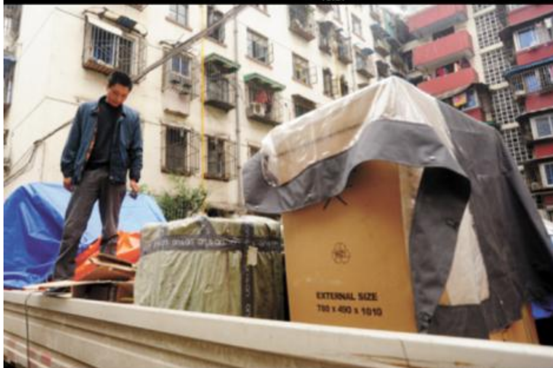
王师傅在清点被退回的丢失货物